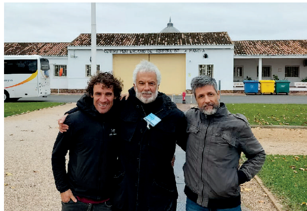
Voluntarios colaborando en el trabajo de género con un taller de cine en el centro penitenciario de Herrera de la Mancha.

Las actividades se realizan en las dependencias adaptadas del Módulo específico que está aislado del resto y en dependencias comunes del centro penitenciario (actividades deportivas y formativas). Se desarrollan en coordinación con el equipo de profesionales del centro penitenciario y con otros recursos externos (seguimientos en salidas de permiso, derivaciones posteriores, etc.).