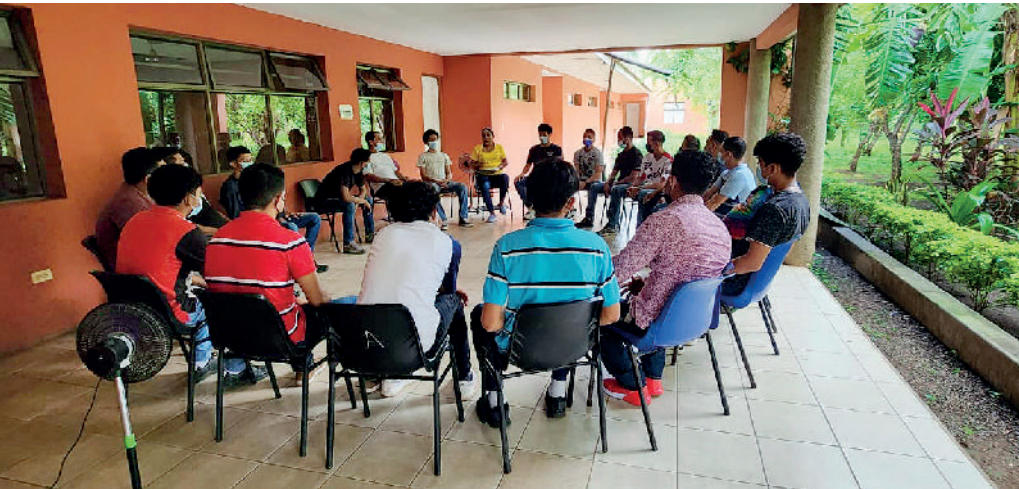
Asamblea en la comunidad terapéutica de CENICSOL. Managua.