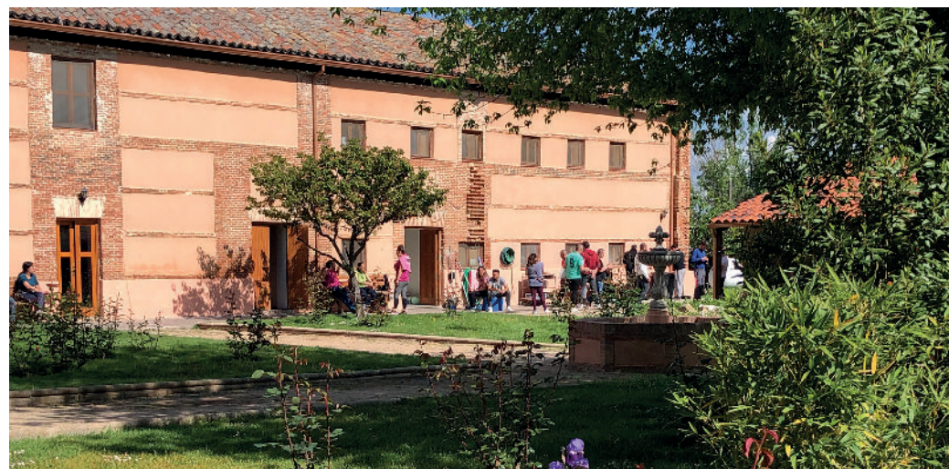
Comunidad terapéutica del programa Base. Finca de Castillejos.