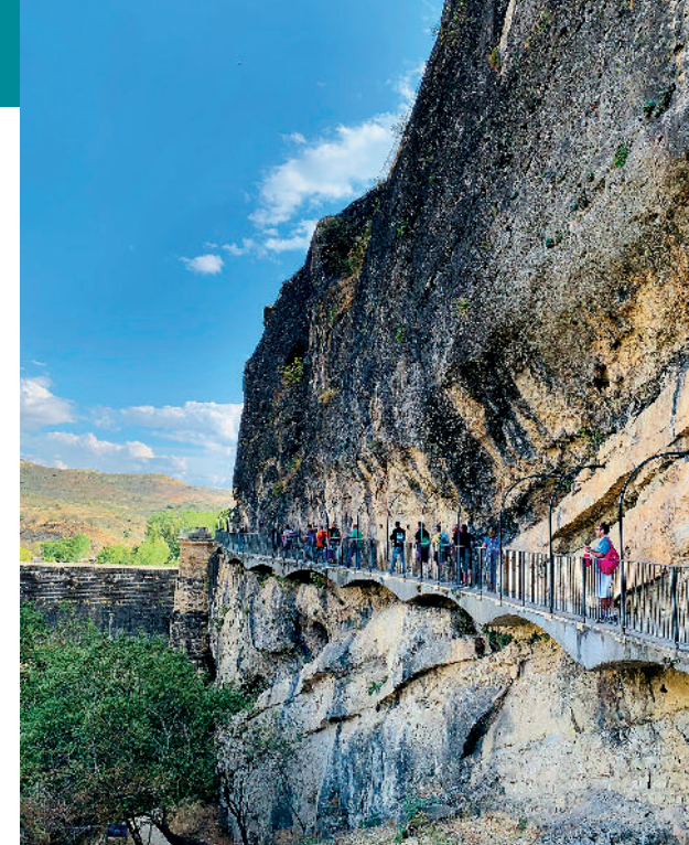
Actividades de ocio saludable. Grupos del programa de alcohol.