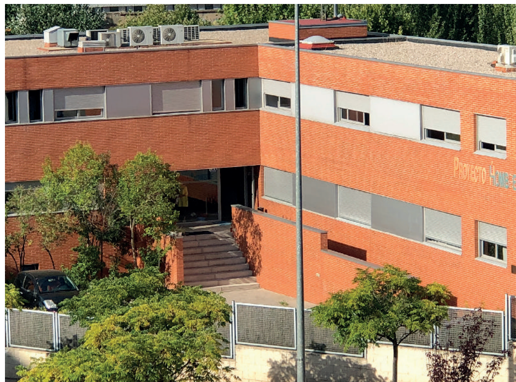
Sede central de Guadalajara. c/ Bolarque.