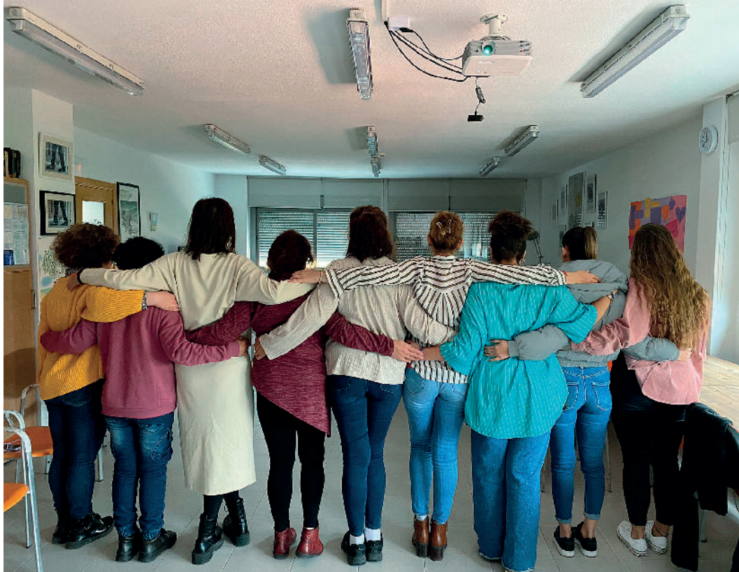
Trabajo específico con mujeres: grupos, talleres, etc.