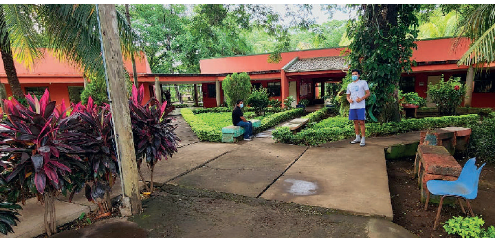
Centro de atención a las adicciones en Managua. CENICSOL.

Los programas desarrollados durante este año 2023 han sido: