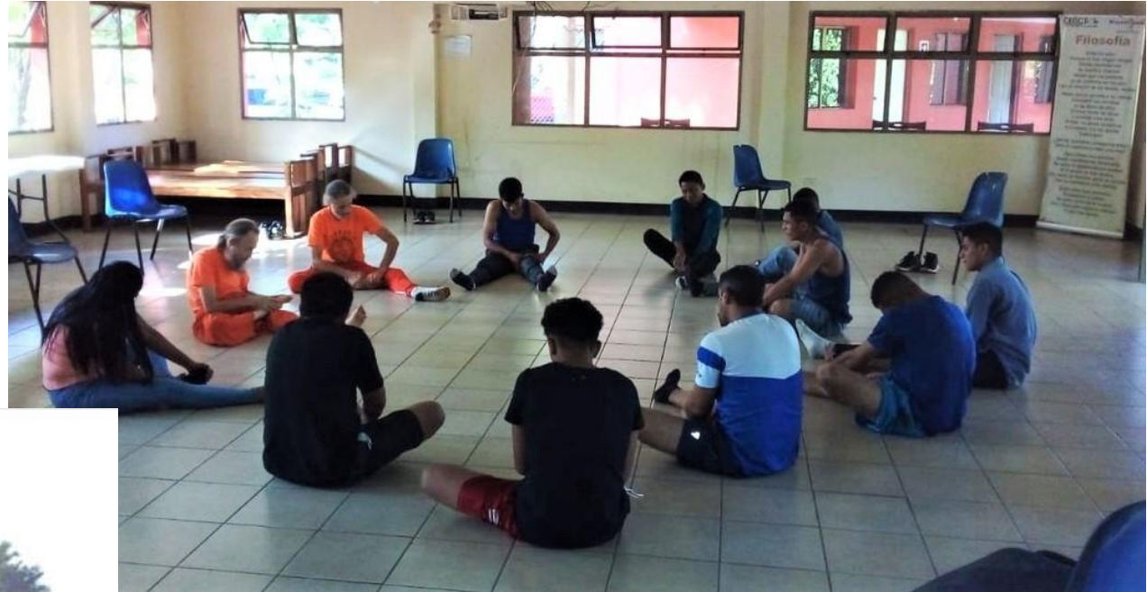
Taller de meditación en CENICSOL

Desarrollado a lo largo del proceso de tratamiento de los adultos y jóvenes atendidos tanto en los recursos residenciales como ambulatorios. Incluye cursos de capacitación laboral, módulo de orientación y búsqueda de empleo, orientación y acompañamiento en la integración familiar, social y formativo-laboral, etc.