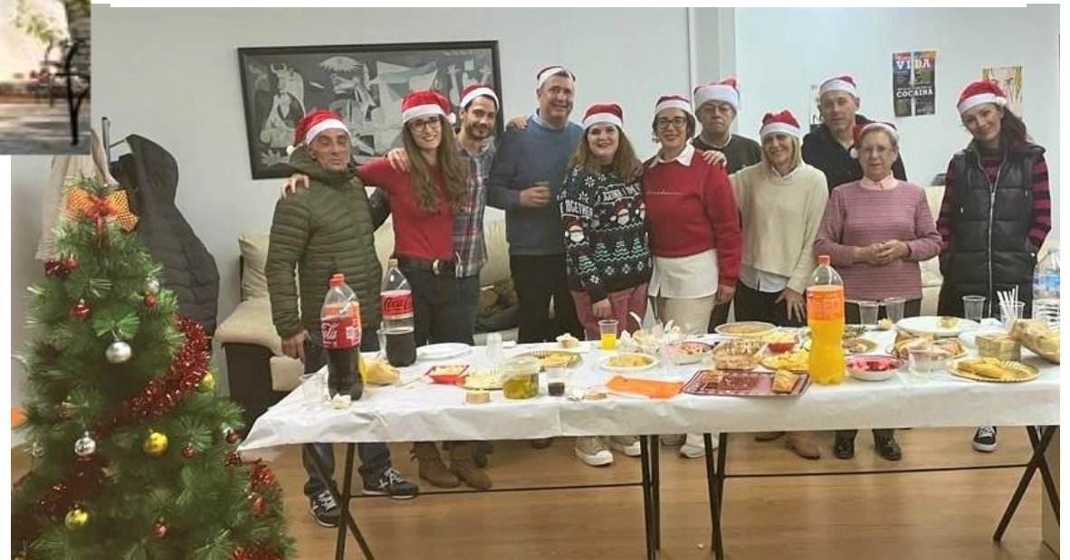
Centro de día de Albacete