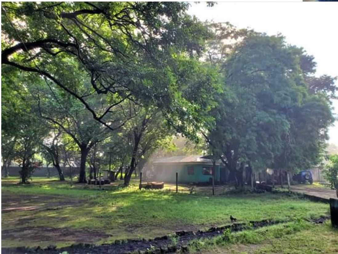
Casita para tratamiento de adolescentes en CENICSOL. Managua