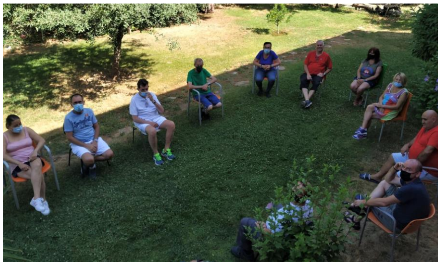
Grupo de autoayuda en el programa de tratamiento de adicción al alcohol