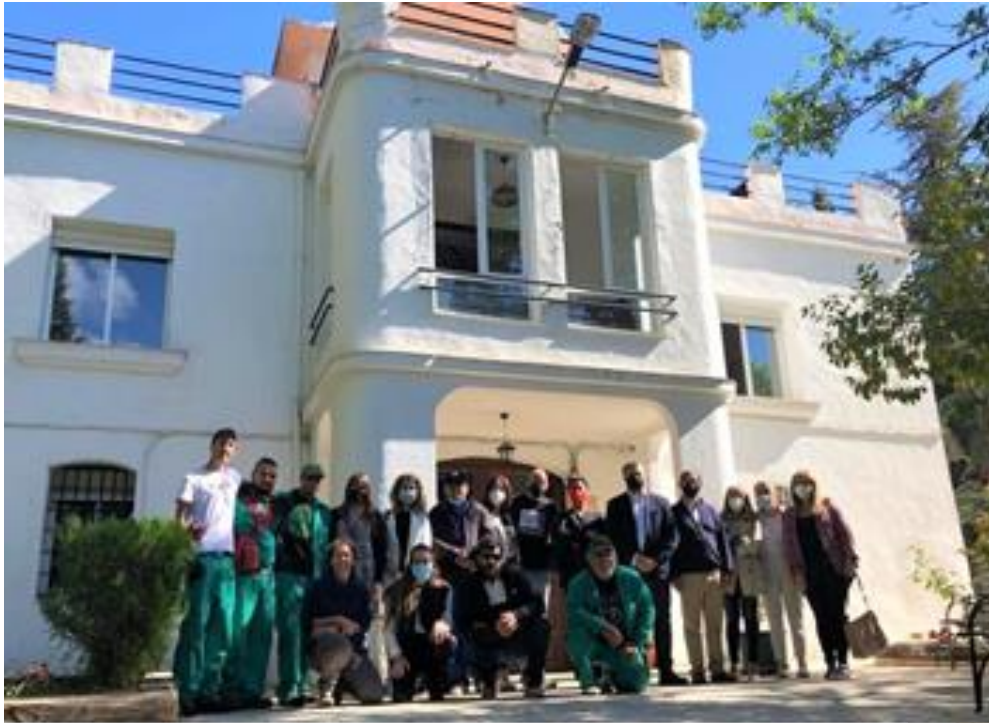
Inauguración “Curso auxiliar vivero y jardines” en el centro de Cuenca