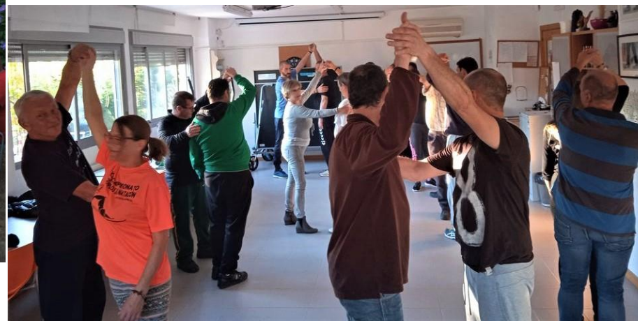
Taller de baile en Programa de tratamiento de la adicción al alcohol