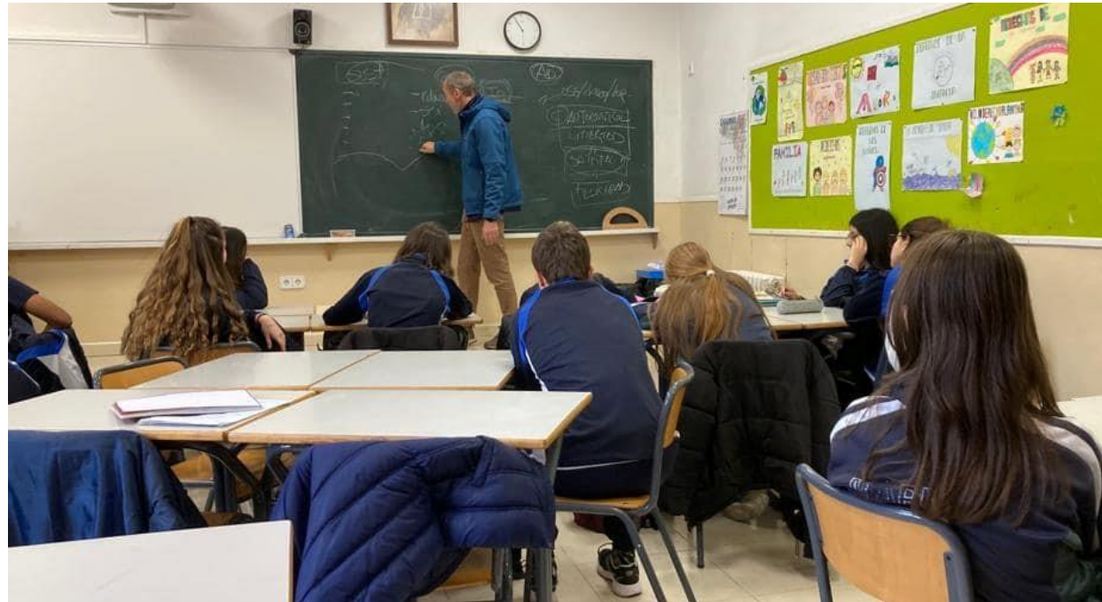
Sesión de un taller de prevención en centro educativo de Guadalajara