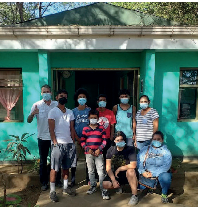
Casa residencial para menores en Managua de CENICSOL