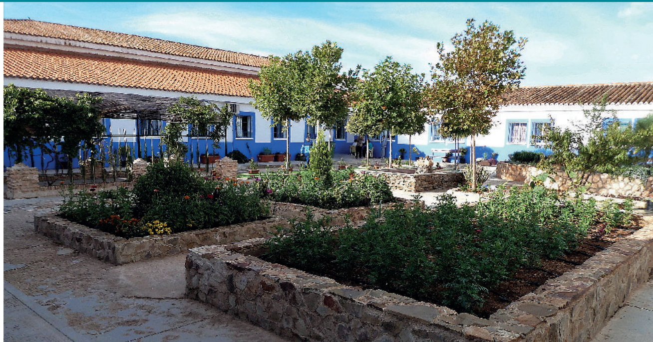
Patio acondicionado por los usuarios del módulo terapéutico de PHCLM en el centro penitenciario de Herrera de la Mancha

También consideramos importante dotar de este significado y sentido rehabilitador al tiempo de estancia en la prisión, con una vida activa y participativa dentro de ella.