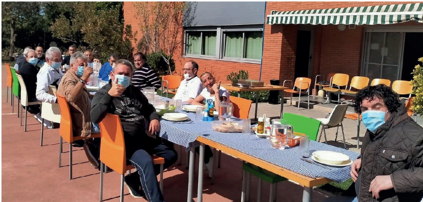
Comida en el patio de la sede central en Guadalajara, con usuarios/as del programa de Alcohol

El recurso tiene una capacidad de 26 plazas y se desarrolla en dos fases, con una duración total aproximada de 17 meses, siendo los 8-10 primeros en régimen residencial y el resto en régimen ambulatorio para apoyo del proceso de reinserción familiar y socio-laboral de las personas atendidas; se realiza desde los dispositivos de PH en Guadalajara, Daimiel, Albacete, Cuenca y Toledo.