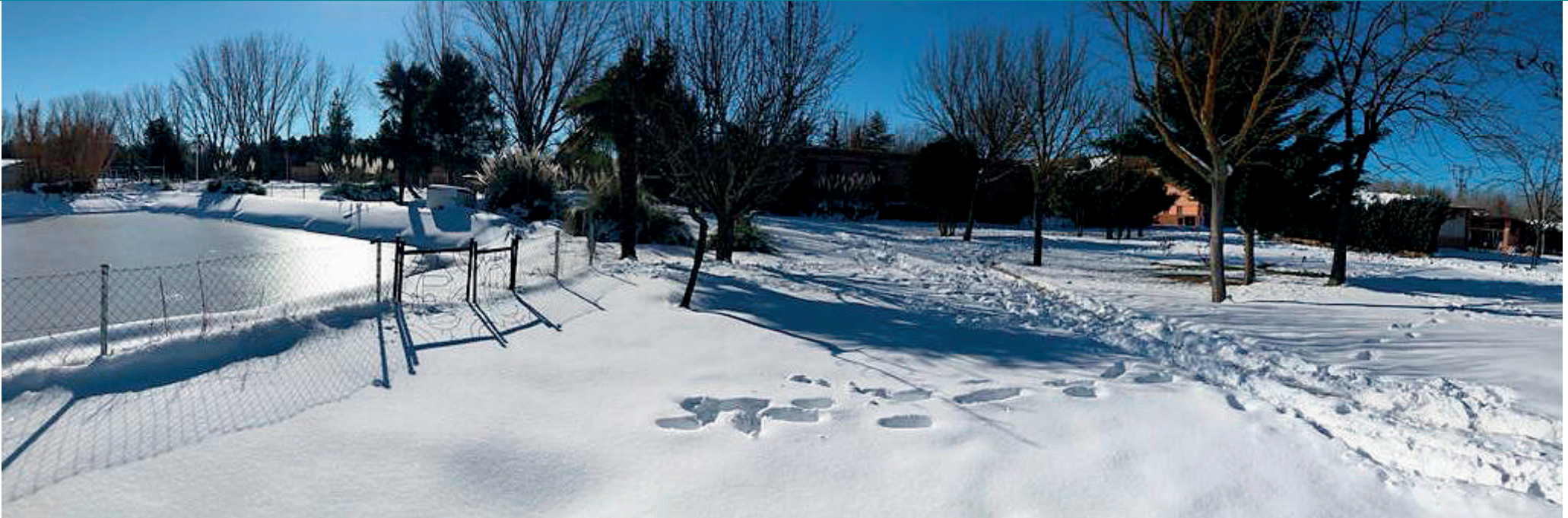
Comunidad terapéutica de Castillejos (Programa Base)