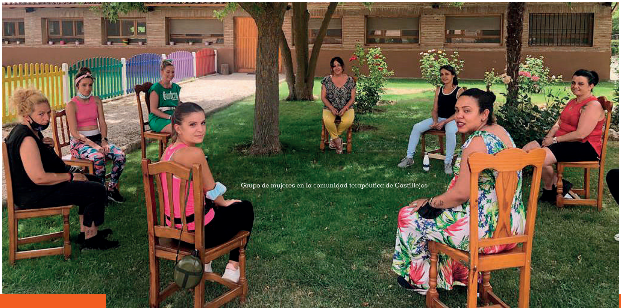
Grupo de mujeres en la comunidad terapéutica de Castillejos