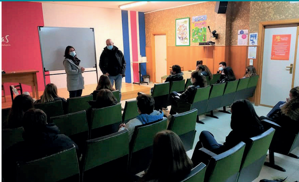
Sesión de un taller de prevención en un Colegio de Guadalajara

También se ofrece a las familias atención de manera individual y grupal, actuando sobre cada núcleo familiar o trabajando de manera general con varias familias por medio de sesiones grupales formativas.