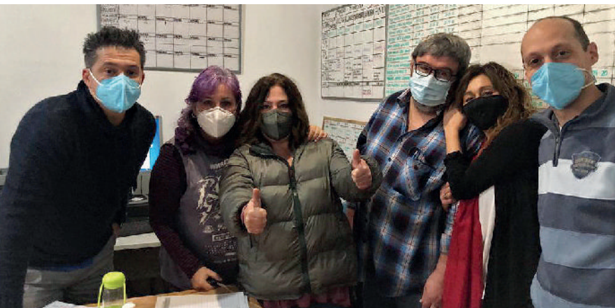
Equipo terapéutico de la comunidad terapéutica de Castillejos