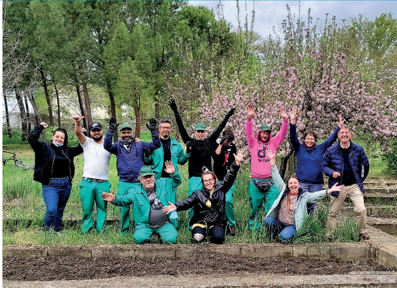
ARRIBA: Curso auxiliar vivero y jardines en el centro de Cuenca. / ABAJO: Congreso en Daimiel

Es un programa que se basa en el modelo bio-psico-social, con un abordaje integral que