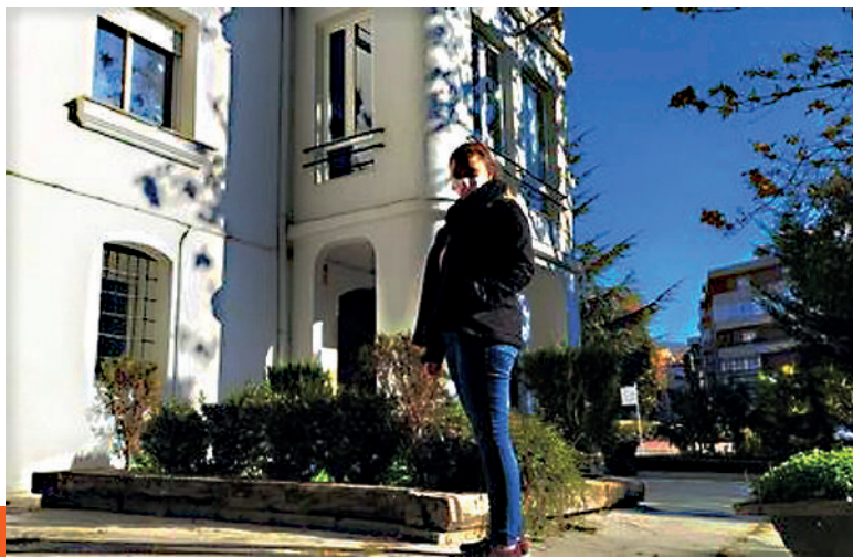
Centro de día y programa ambulatorio en Cuenca