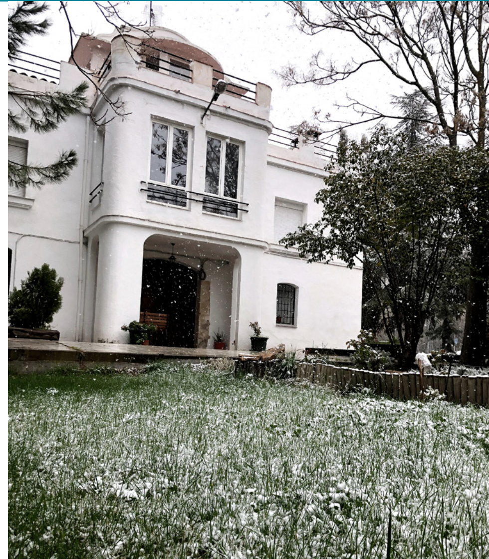
Centro de día y programa ambulatorio de Cuenca