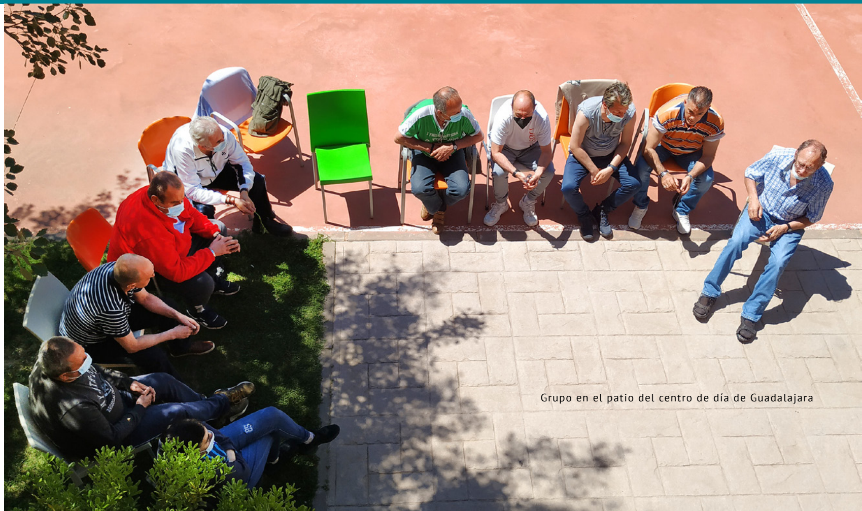
Grupo en el patio del centro de día de Guadalajara

El recurso tiene una capacidad de 26 plazas y se desarrolla en dos fases, con una duración total aproximada de 17 meses, siendo los 8-10 primeros en régimen residencial en la sede principal de Guadalajara y el resto en régimen ambulatorio para apoyo del proceso de reinserción familiar y socio-laboral de las personas atendidas desde los dispositivos de Guadalajara, Daimiel, Albacete, Cuenca y Toledo.