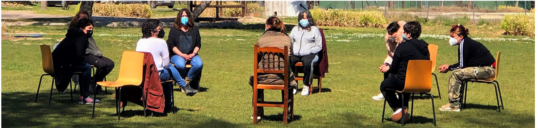
Grupo de mujeres en la comunidad terapéutica de Castillejos