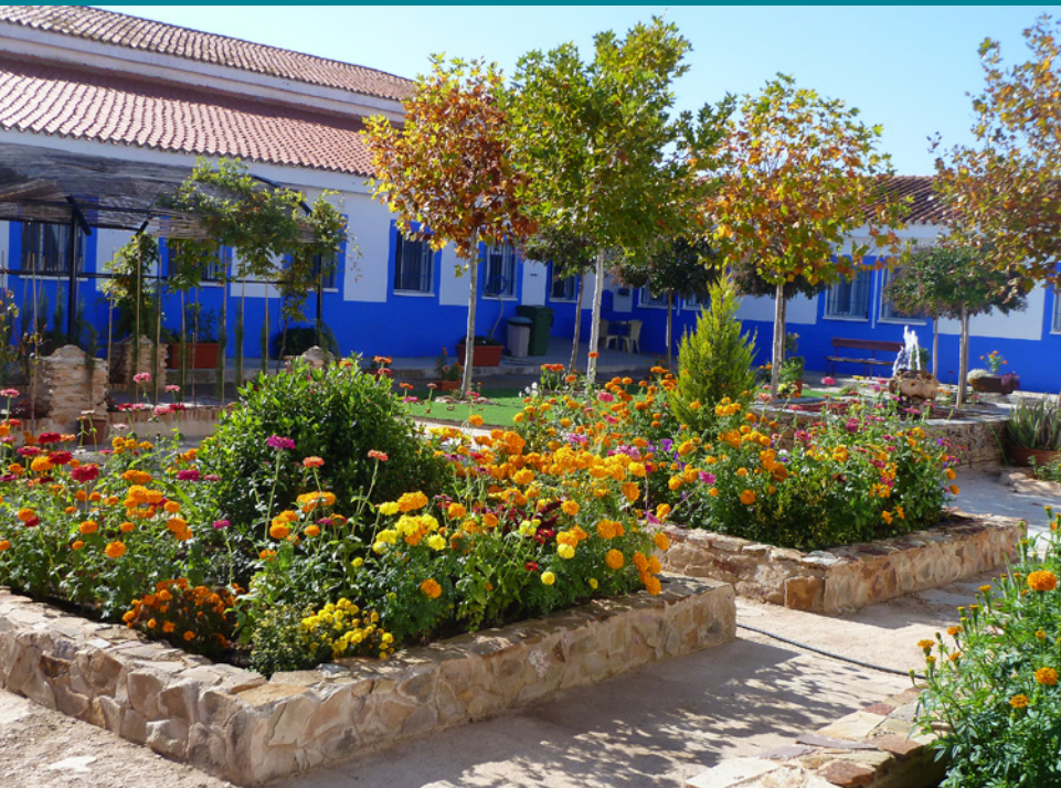
Patio del módulo terapéutico de PHCLM en Centro Penitenciario de Herrera de la Mancha